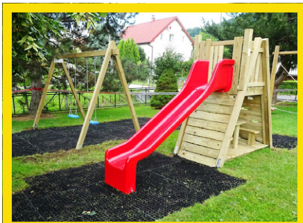
Igrala za šolarje in vrtčevske otroke (Žiče); vrednost: 7.000 evrov

Zaradi epidemije koronavirusa so 'Dobrodelni koncert 2020' na predlog predlagatelja (Leo klub Konjice) in Smejalnice (Stand up večeri v konjiškem Domu kulture) prestavili na leto 2021.