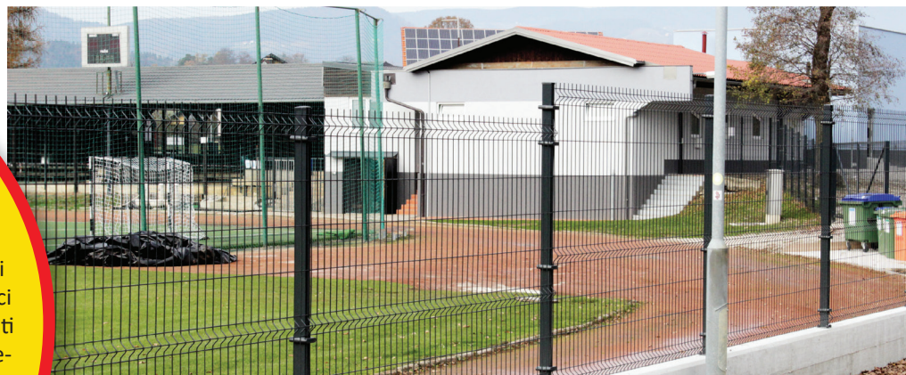
ŠRC Dobrava je zavarovan z novo ograjo, tamkajšnji objekt pa ima tudi novo streho in fasado.

Bistveni poudarki strategije temeljijo na analizi in izraženih potrebah občanov, društev in krajevnih skupnosti kot ključnih deležnikov v športu. Seveda vseh želja v strategijo ni mogoče zapisati – pripravljavci dokumenta pa so se trudili zajeti tisto, kar lahko v desetih letih realno dosežejo.