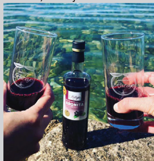
Sok iz ekološke aronije Kmetije Ratajc že vrsto let osvaja priznanja.

Na državnem ocenjevanju vin Vino Slovenija v sklopu sejma Agra sta medalje osvojila tudi: Zlati grič (zlato za sivi pinot letnik 2019 in srebrna za beli pinot 2019) in Vinska klet Meum Winery s Klokočevnika (srebrna za vino Meum char-donnay, letnik 2018).