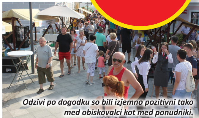
Odzivi po dogodku so bili izjemno pozitivni tako med obiskovalci kot med ponudniki.

Že četrto leto zapored so v starem mestnem jedru Slovenskih Konjic organizirali Jurijev festival kulinarike in domačih obrti. Dogodek so drugič pripravili v sklopu občinskega praznika Občine Slovenske Konjice, pred tem so ga izpeljali ob tradicionalnem jurjevanju, ki ga je letos 'odnesel' koronavirus, lani pa slabo vreme. Tokrat so se predstavili le ponudniki z območja turistične destinacije Rogla-Pohorje, obiskovalci niso bili ne že- ni ne lačni.