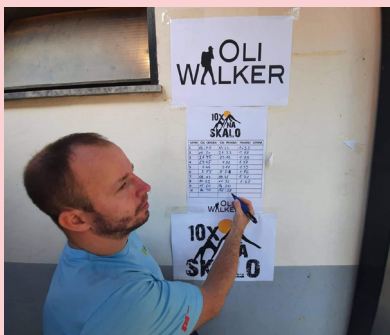
Na poti 'gor in dol' so se mu pridružili tudi prijatelji in znanci, ki so se v vlogi pomočnikov izmenjevali.

Ministrica za pravosodje Lilijana Kozlovič je s svojo ekipo obiskala Slovenske Konjice. Srečala se je z zaposlenimi na konjiškem sodišču, Zavodu za šport in županom. Ne delovnem obisku je med drugim povedala, da sodišče ne bodo ukinjali.