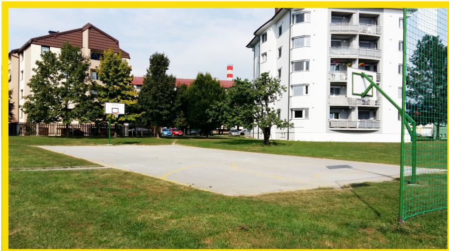
Ureditev igrišča – Ulica Toneta Melive; vrednost: 1.400 evrov