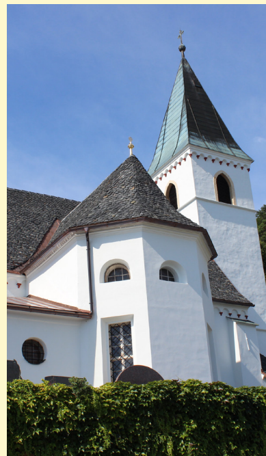
Obnovili so zunanost cerkve.