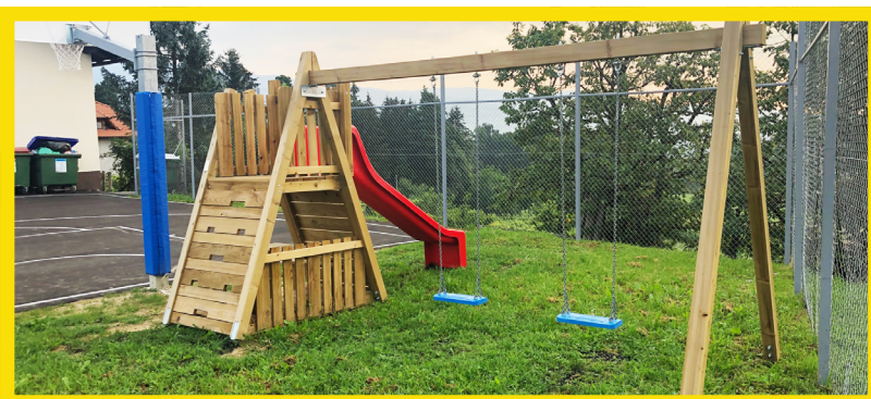
Postavitev otroških igral pri domu krajanov Bezina; vrednost: 7.000 evrov

Projekti, ki jih bodo izvedli v naslednjih dveh letih, so: Športno-rekreativno igrišče v naselju Škalce, Izgradnja – postavitvev mini golf igrišča pri kopalnem bazenu na Zbelovem; Ureditev zelenice – parka s potkami, okrasnimi grmovnicami in drevesi, vodno fontano in razsvetlavo (KS Zbelovo); Arti / tek / turni poligon (KS Slovenske Konjice); Zasteklitev vhodnega portala v mrliško vežico na Sv. Jerneju; Ureditev ceste in pešpoti od križišča Cesta pod goro proti graščini Trebnik; Ureditev javnega odprtega prostora (KS Polene); Petelinjek – nadgradnja naravnoslovne učne poti (KS Sveti Jernej); Dobrodelni koncert (Leo klub Konjice); Košarkarsko igrišče (Bezina); Obnova asfaltne podlage na igrišču za hokej v konjiškem parku; Preplastitev nogometnega igrišča v Ločah; Razsvetljava atletskega stadiona (pri OŠ Ob Dravinji); Smejalnice (Stand up večeri v konjiškem Domu kulture); Ureditev parkirišča pred športnim igriščem v Sp. Grušovju; Ureditev prostora za postavitvev gugalnice, namenjene invalidom na invalidskih vozičkih (ob OŠ V parku); Ureditev športnega parka v KS Zeče.