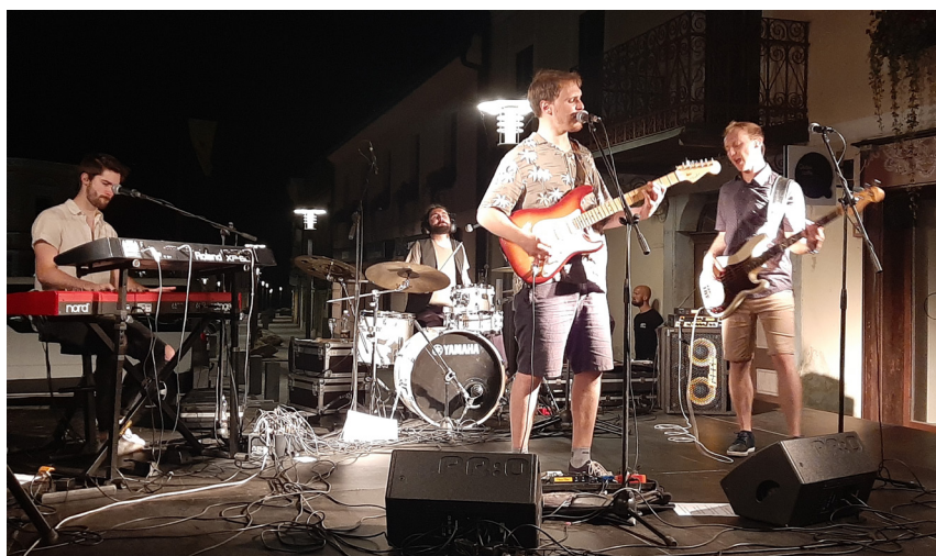
Za vrhunec Poletnic so poskrbeli domačini, člani skupine Take OFF.

V negotovem 'koronskem' koncertnem poletju je Centru za kulturne prireditve Slovenske Konjice uspelo pridobiti pozitivno mnenje Nacionalnega inštituta za javno zdravje (NIJZ) za izpeljavo Poletnic. Obisk na vseh štirih izpeljanih koncertih, en koncert smo morali zaradi dežja odpovedati, je bil odličen, obiskovalci zadovoljni, utrip mesta poletno živahen. Želja po druženju in ljubezen do glasbe kljub številnim omejitvam ni izgubila naboja, moči.