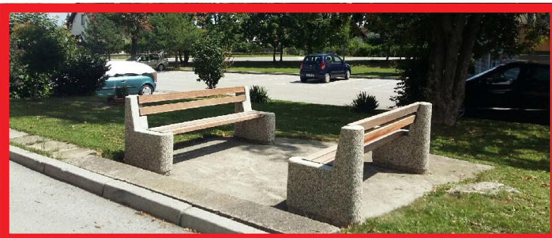
Zunanje klopi na Kajuhovi ulici; vrednost: 1.000 evrov