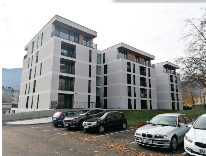
Večstanovanjski objekt 3K

V Tepanju nameravajo v naslednjih letih zgraditi več novih večstanovanjskih objektov. Letos so za to pozidavo sprejeli OPN. Objekt z neprofitnimi stanovanji pa so začeli graditi v Spodnjih Prelogah.