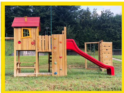
Otroška igrala pri igrišču Bezina; vrednost: 6.000 evrov