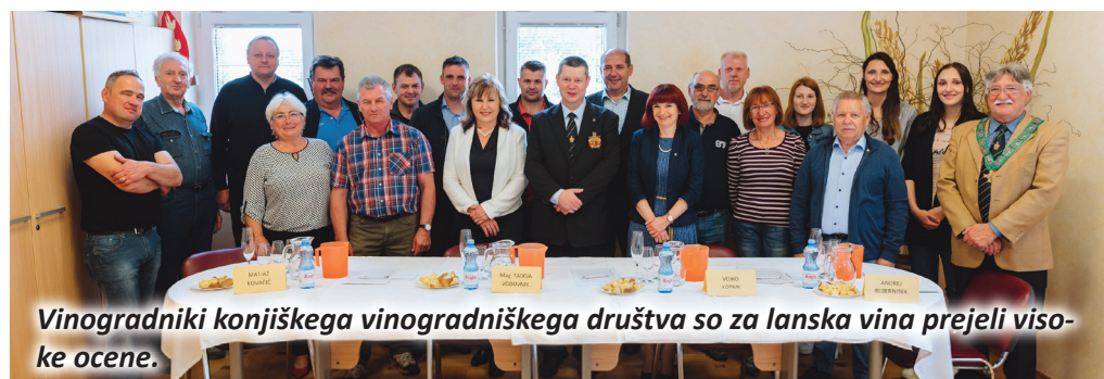
Vinogradniki konjiškega vinogradniškega društva so za lanska vina prejeli visoke ocene.

Vinogradništva Krošl, ki je doseglo najvišjo povprečno oceno med rednimi trgovskimi za tri vzorce različnih sort.