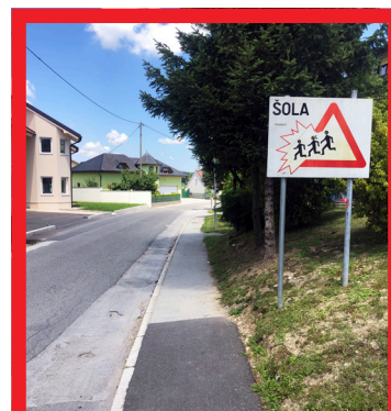
Zavarovanje šolske poti (Loče); vrednost: 4.000 evrov