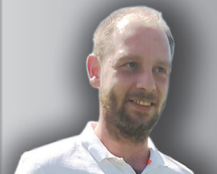
Nogometno društvo Dravinja (člani) , najboljša moška ekipa.