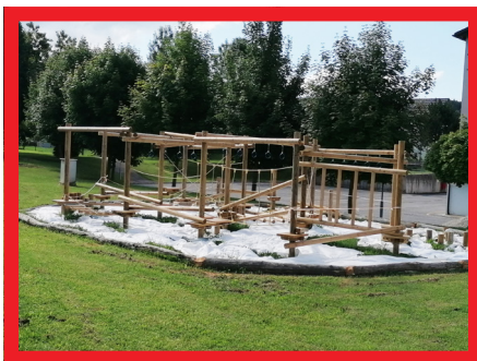
Izgradnja otroških igral v Ločah; vrednost: 10.000 evrov