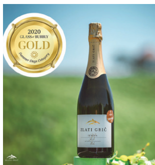
Zlato medaljo je z Londona prinesel Zlati grič.

Penine s Konjiškega so med najboljšimi na svetu. Na prestižnem ocenjevanju penin Glass of bubbly v Londonu sta namreč medalji osvojili tudi peni Zlatega griča in kleti Vina Založnik.