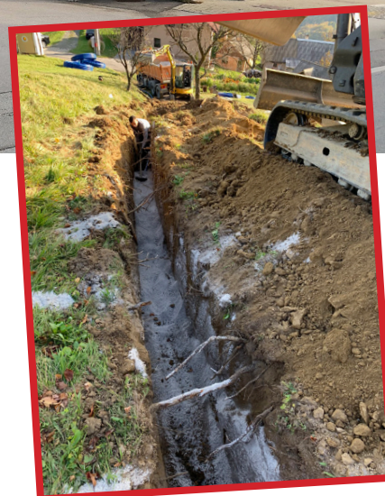
Tolsti Vrh – gradili so štiri kilometre cevovodov.

Tudi na drugih področjih so se modernizirali. Med drugim so spremenili logistiko v zbirnem centru CERO Slovenske Konjice (razširitev, namestitve električne zapornice) in za zbirni center nabavili 10 kubičnih metrov velike zabojnike. Na pokopališčih v Žižah in Slovenskih Konjicah so izgradili žarni zid. Obnovili so fekalno in meteorno kanalizacijo od Mizarske ulice do Industrijske ulice ter fekalni kanal Škalska cesta (pri hotelu Dravinja) in izvedli fekalno in meteorno kanalizacijo (Stari trg 3) v Ločah. Na centralni čistilni napravi v Slovenskih Konjicah so vgradili toplotno črpalko, s čimer so zmanjšali stroške ogrevanja, maja pa so začeli upravljati še s čistilno napravo Zbelovo. In javne površine: ureditev krožišča pri Hoferju, postavitev pitnika za vodo v zgornjem parku, postavitev dodatne urbane opreme (klopi, koši s pepelnikom), ureditev peščenih poti v parku pod Trebnikom.