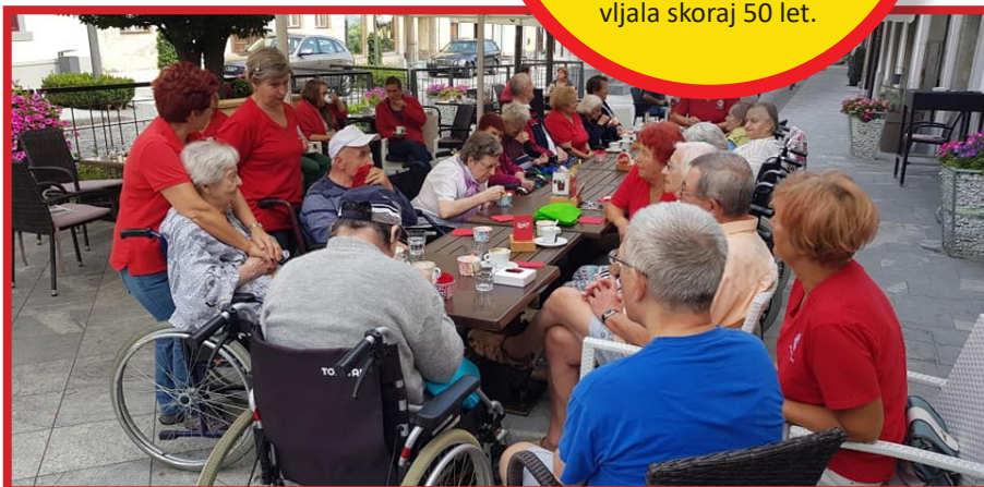
Lanski utrinek s priljubljenega Vozičkanja.

* Pomoč v prehrani: nabavo hrane financirajo vse tri občine iz občinskih proračunov, v zadnjih štirih letih so skupno