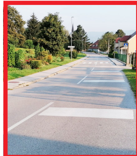
Ureditev križišča – Tovarniška cesta; vrednost: 3.000 evrov