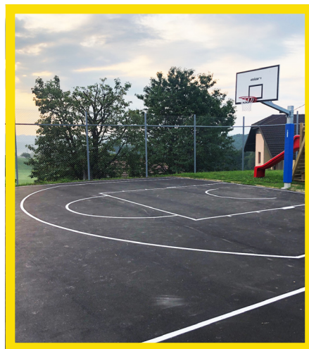
Obnovitev športnega igrišča pred domom krajanov Bezina; vrednost: 3.000 evrov