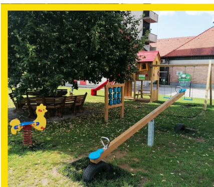
Otroški park (Draža vas); vrednost: 6.000 evrov