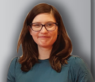
Ženski košarkarski klub Konjice (članice) , najboljša ženska ekipa;