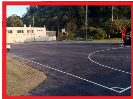
Igrišče Zbelovo; vrednost: 23.000 evrov